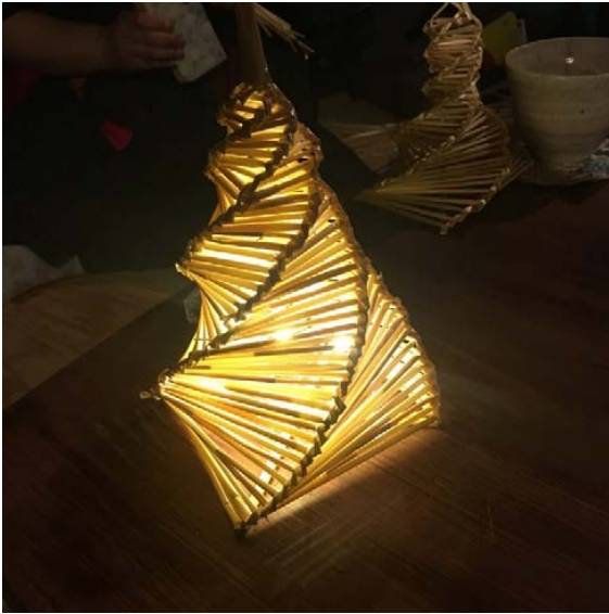
Рис. 7. На современных изображениях клеточка для светлячка и стилизации светильников под нее представляют собой витую из соломы или тростника фигурную подвеску или плетеную из лозы корзинку