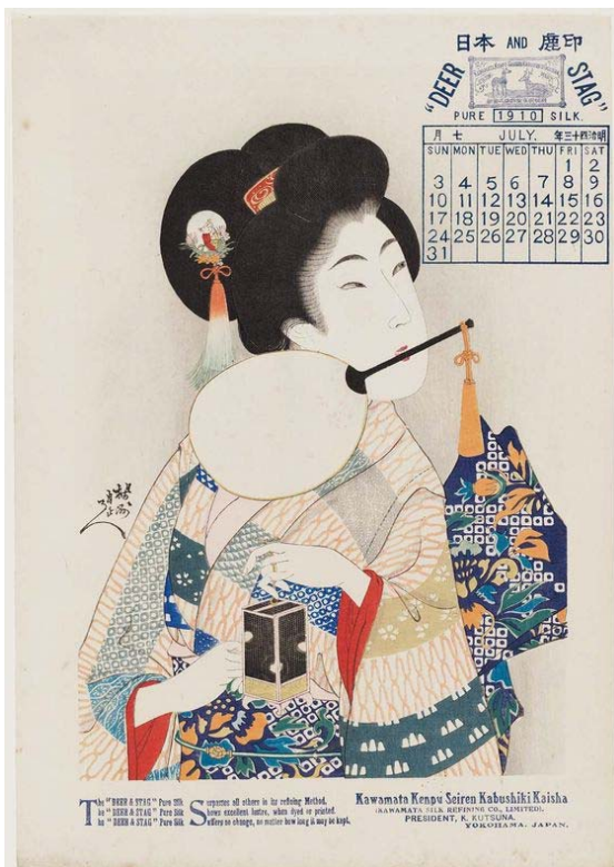
Рис. 5. Календарь, напечатанный в июле 1910 г.: Красавица, держащая Ручку Болельщика Между ее Зубами и Клеткой Светлячков. Музей изобразительных искусств, Бостон