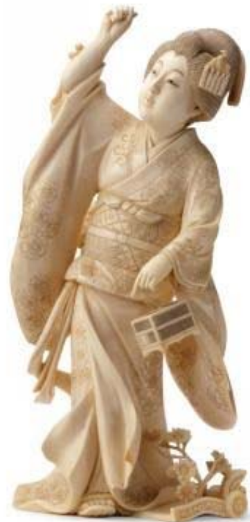
Рис. 6. Ryoshin Nakamura. Okimono, Lady with firefly cage . Late 19 th – early 20 th century, ivory. AGSA (Галерея искусств Южной Австралии)